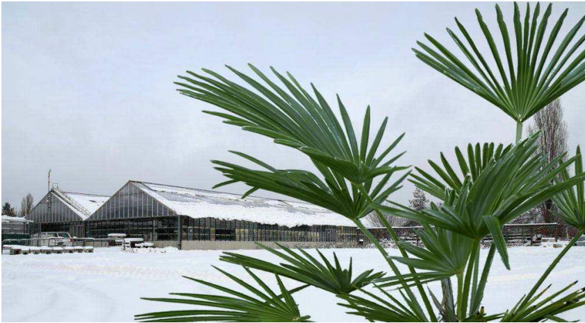
Stand September 2018

Auch in diesem Jahr möchten wir Ihnen die fachgerechte Überwinterung Ihrer Pflanzen (von Oktober bis Mai) anbieten.